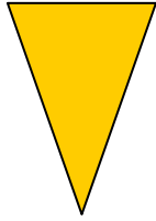
MOD. KV-1500-EL SPEZIAL 400 V